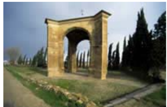
Humilladero ( Calahorra)