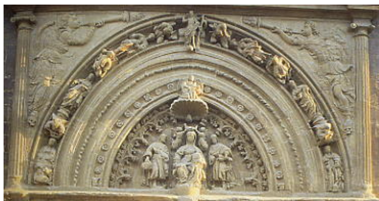
Detalle de la Puerta de San Jerónimo (Catedral de Santa María)

La primera visita del peregrino por importancia y por cercanía es la del Templo Catedral de Calahorra donde se conservan abundantes recuerdos jacobeos en sus muros y en sus documentos.