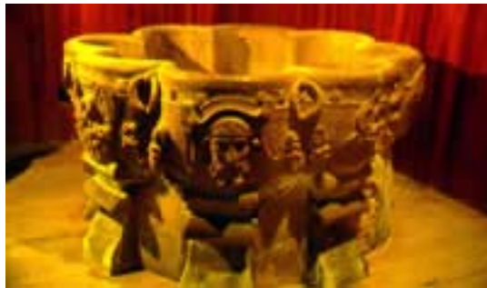
Pila Bautismal (Catedral de la Diócesis)

Naturalmente todo el templo en si es un recuerdo de las peregrinaciones jacobeanas contando con infinidad de motivos de las mismas que cada uno podrá descubrir en sus retablos, en sus capillas y en sus pinturas, así como en todos los monumentos de los puntos que atraviesa este camino del Ebro que durante siglos ha visto el caminar de los peregrinos en su afán de alcanzar la meta de la visita y el abrazo a la tumba del Apóstol y conseguir así la redención de sus pecados o el cumplimiento de la promesas realizadas por la obtención de alguna dádiva del Santo de los Peregrinos.